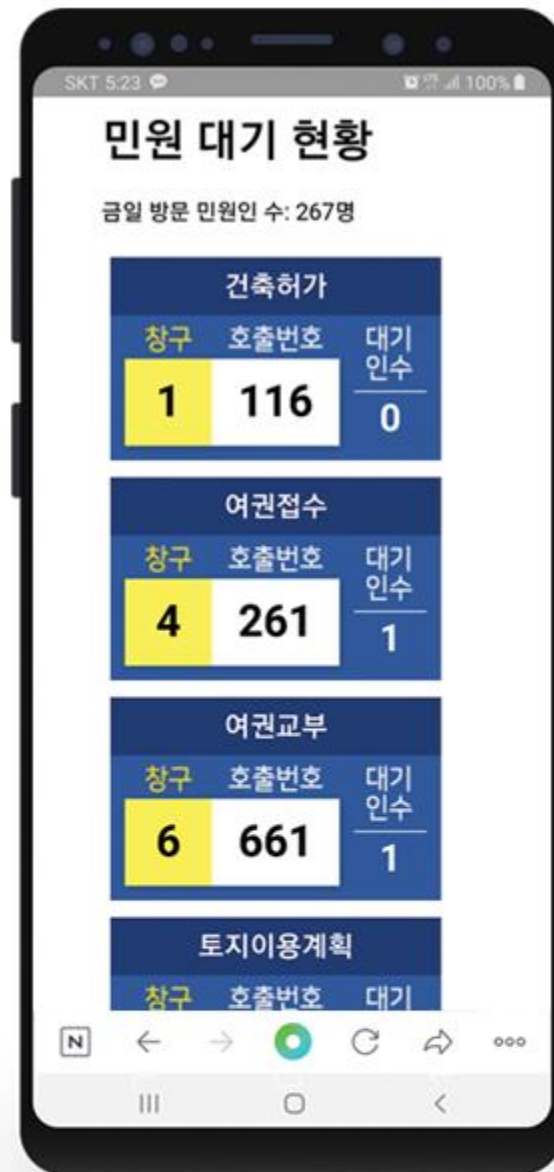
< 달서구청 모바일 연동 >