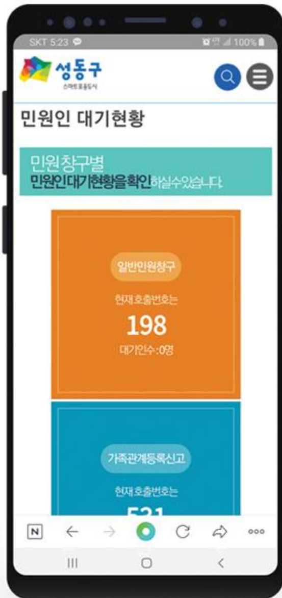
< 성동구청 모바일 연동 >